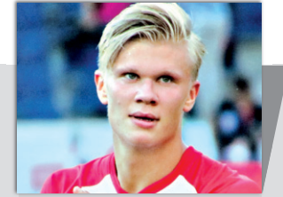
ହାଲାଣ୍ଡଙ୍କୁ ଗୋଲଡେନ୍ ବଲ ପୁରସ୍କାର

'ଜିରୋ-ଏମିଶନ ଇଲେକ୍ଟ୍ରିକ ମୋବିଲିଟି' ପରୀକ୍ଷା ସଫଳ